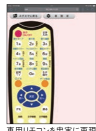
専用リモコンを忠実に再現しています。