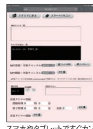
スマホやタブレットですぐカンタンに音声を送信できます。